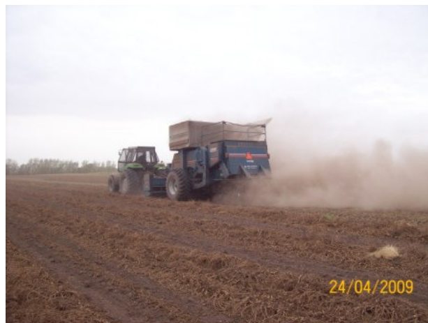
Foto 2. Cosecha del lote de maní de la foto 1