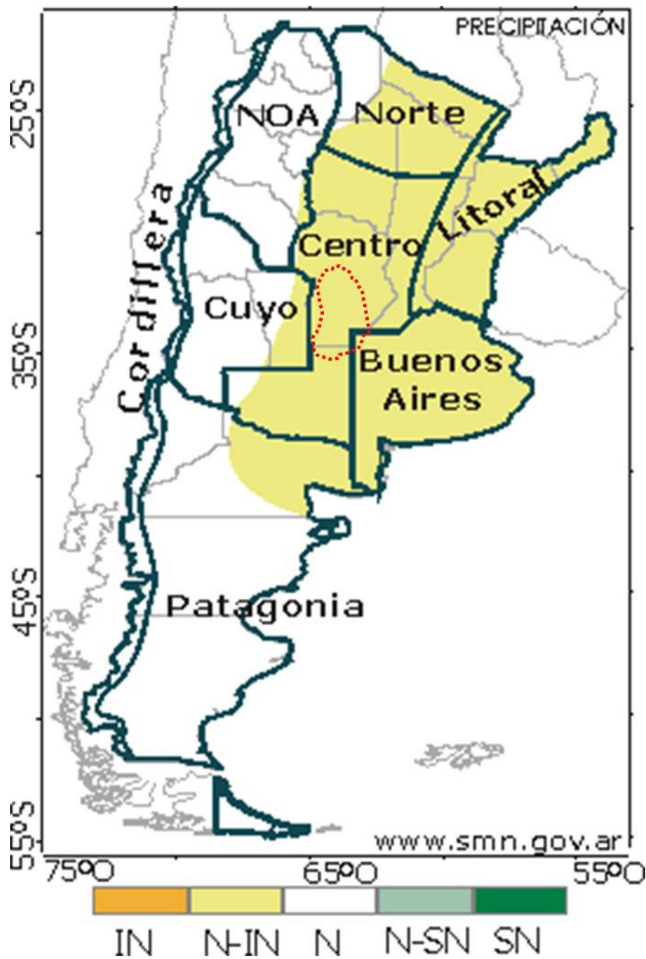
Mapa 2. Tendencia de las precipitaciones para el trimestre abril – mayo y junio 2009 (SMN).

IN: inferior a lo normal; N-IN: normal o inferior a lo normal; N: normal; N-SN: normal o superior a lo normal; SN: superior a lo normal