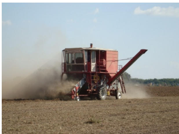
Fotos 3 y 4. Y todavía cosechan...