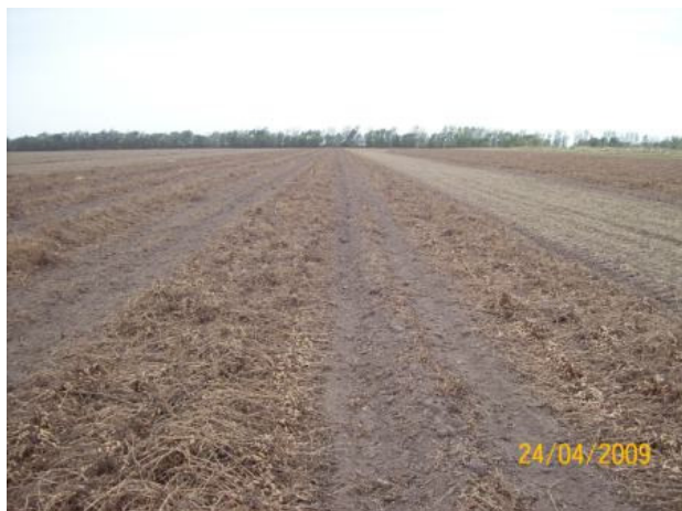
Foto 1. Lote de buen rendimiento, listo para su cosecha