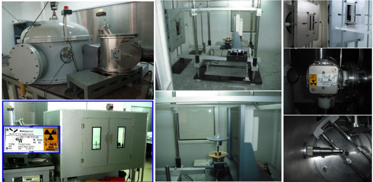
FIGURA 1: Microtomógrafo computado de alta resolución en LIIFAMIRx.